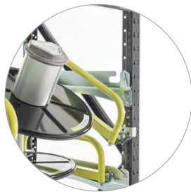
Position zum einfachen Bestücken der Ringabwickler.