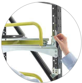
Alle Abroller werden gegen Herausfallen gesichert.

Der Abroller wird in seiner Trageschiene vorgezogen und abgesenkt. So kann der Ring einfach aufgelegt werden.