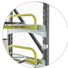
Position der Tragschienen ist variabel und schnell einstellbar.